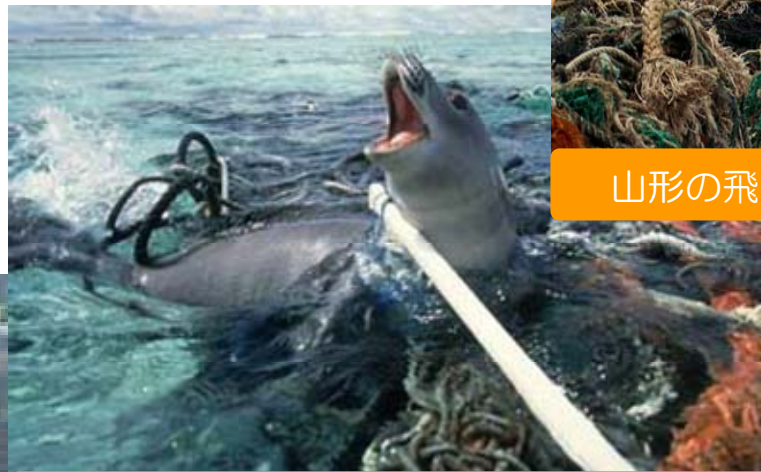
海洋ごみからまってしまった動物