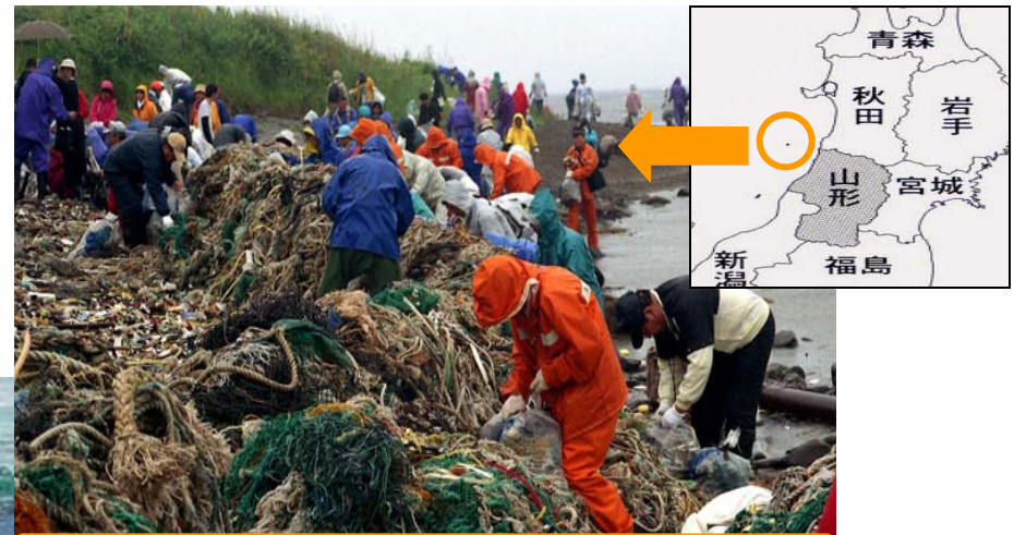
山形の飛島に流れ着いた海洋ごみの山