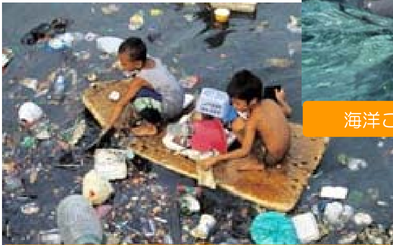
日本だけでなく外国の海岸にも・・・